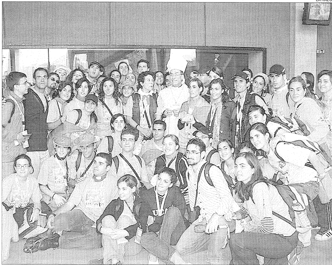
Los voluntarios de la Universidad de San Antonio, durante la Jornada Mundial de la Juventud en Colonia

Durante su estancia en la Región de Murcia, la que ya muchos denominan como la Cruz de los Jóvenes, visitará la Universidad Católica de Murcia, donde será portada por personas de la comunidad universitaria que han estado en algún encuentro de jóvenes con el